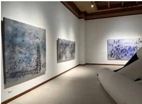
Manuel Zumbado. Habitar el Borde. Galería Nacional. Noviembre 2023.

In this new perspective of Zumbado in la Galería Nacional, the enemy is emptiness, an abyss to which we direct our steps, it is the edge of the world that tempts us to have a frontier experience, to inhabit it, but without realizing that this emptiness is, as I said, the beast that we lodge in ourselves, a mark or stigma that we adopt when we begin to take our first steps in life