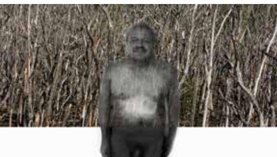
Quirval. Alter Egos 2022.