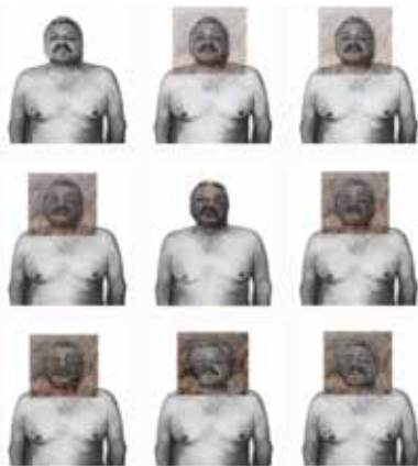
Quirval. Alter Egos 2022.