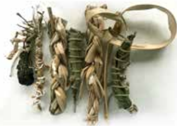
Quirval. Alter Egos 2022.