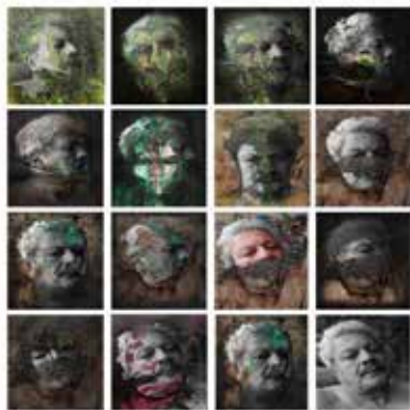
Quirval. Alter Egos 2022.