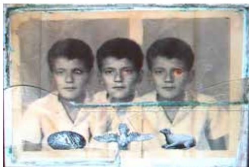
Quirval. Autorretrato, 1999.

Para algunos individuos importa asumir una investigación autorreferencial al buscar su avatar o alter ego, en tanto que con nuevas identidades y distintos nombres se sienten mejor únicos; abren los poros de la sensibilidad y psique a la experiencia, ahí donde gesta la pulsión de su más íntima expresión de sí .