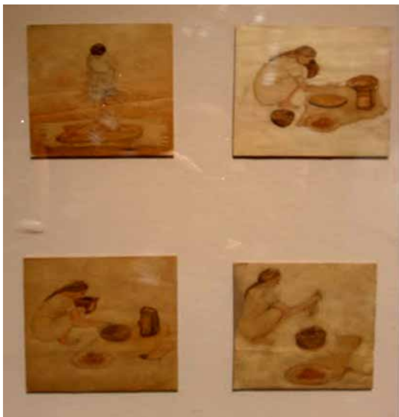
Zulay Soto, procesos de la cerámica de La Gran Nicoya. Museo de Jade y la Cultura Precolombina.