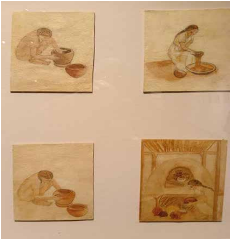
Zulay Soto. procesos de la cerámica de La Gran Nicoya. Museo de Jade y la Cultura Precolombina.