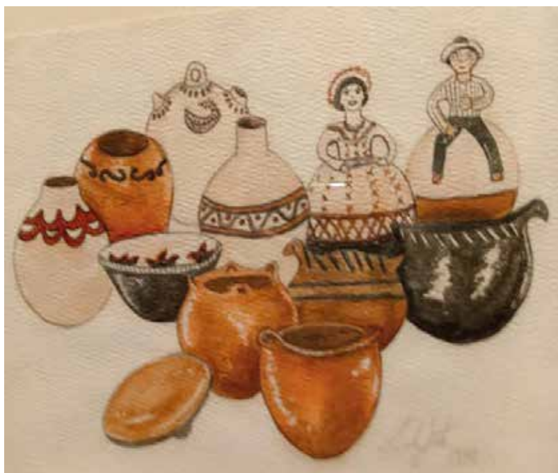
Zulay Soto. acuarelas de las cerámicas de La Gran Nicoya. Museo de Jade y la Cultura Precolombina.