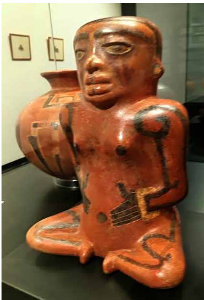
14 Cerámica de La Gran Nicoya. Colección deñ Museo de Jade y la Cultura Precolombina.