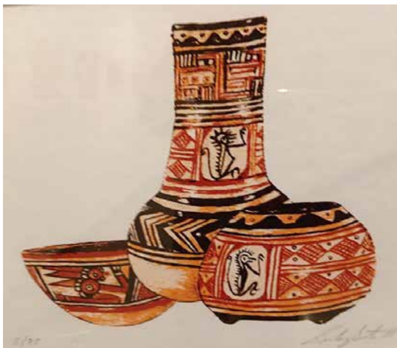
Zulay Soto, acuarelas de las cerámicas de La Gran Nicoya. Museo de Jade y la Cultura Precolombina.