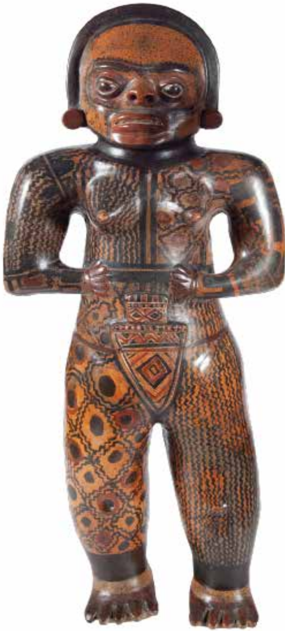
Cerámica de La Gran Nicoya. Colección deñ Museo de Jade y la Cultura Precolombina.