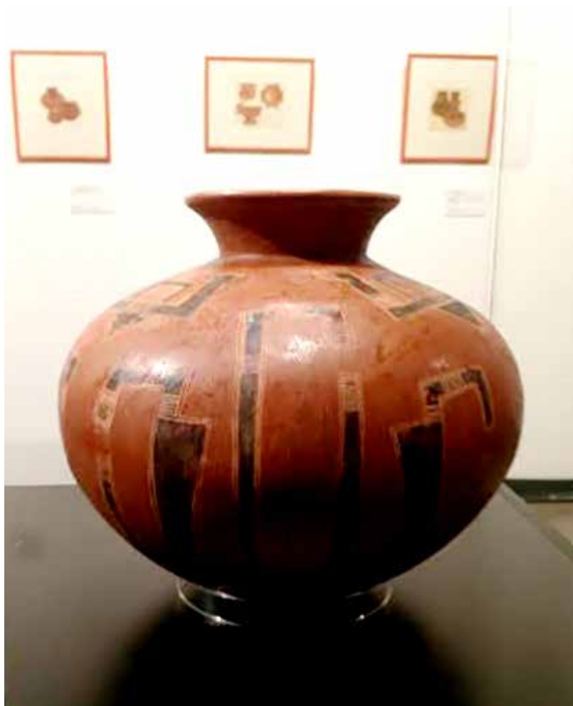
Cerámica de La Gran Nicoya. Colección deñ Museo de Jade y la Cultura Precolombina. Foto cortesía de la artista.