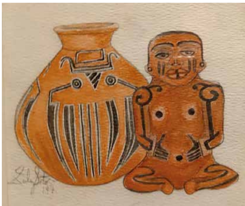
Zulay Soto, acuarelas de las cerámicas de La Gran Nicoya. Museo de Jade y la Cultura Precolombina.