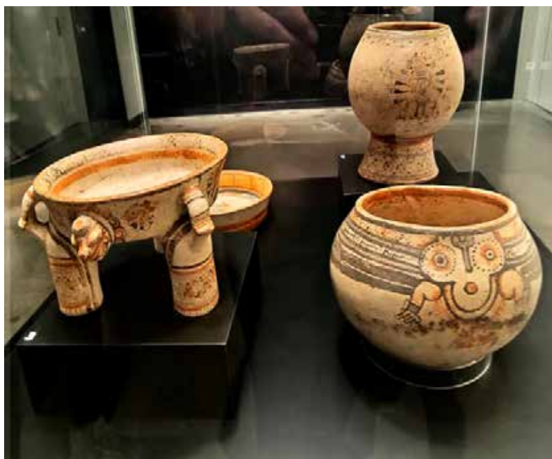
Cerámica de La Gran Nicoya. Colección deñ Museo de Jade y la Cultura Precolombina.