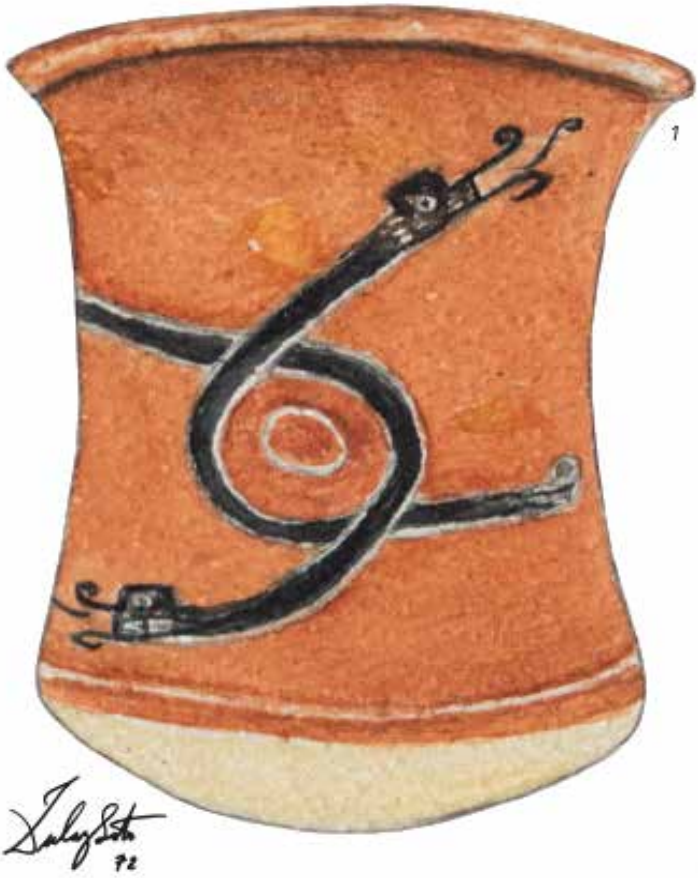
Zulay Soto. acuarelas de las cerámicas de La Gran Nicoya. Museo de Jade y la Cultura Precolombina.