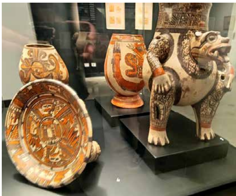
Cerámica de La Gran Nicoya. Colección deñ Museo de Jade y la Cultura Precolombina.