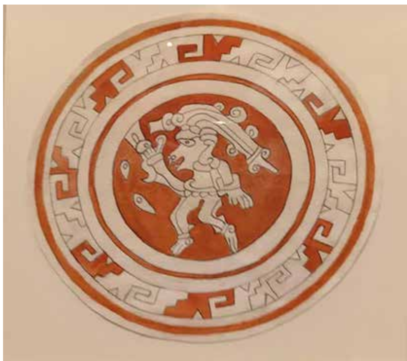
Zulay Soto, acuarelas de las cerámicas de La Gran Nicoya. Museo de Jade y la Cultura Precolombina.