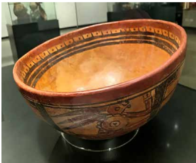
Cerámica de La Gran Nicoya. Colección deñ Museo de Jade y la Cultura Precolombina. Foto cortesía de la artista.