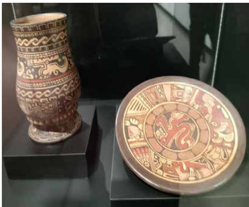
Cerámica de La Gran Nicoya. Colección deñ Museo de Jade y la Cultura Precolombina.