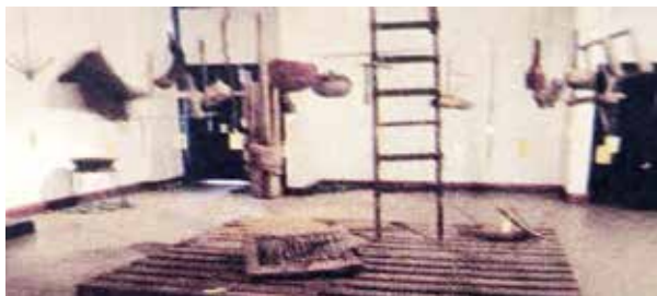
Objetos expuestos en Sale 2, detalle.

The Argentinian art critic Damián Bayón stated in an article from those years that "these artists began to use 'artistically' elements of everyday life, incorporating them into their own creations". (D. Bayón "High" & "Low" en el Arte Moderno. The return of days. 1992).