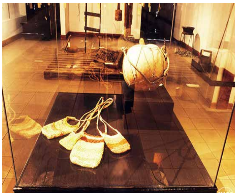
Objetos en madera, cerámica, tejidos y jícaros.