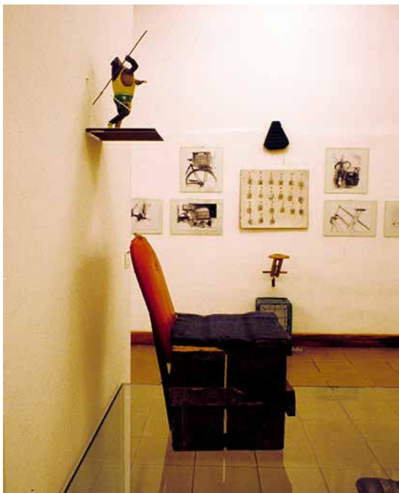
"Agua con Azúcar y muestra Provisional 1" del gabinete Ordo Amoris de Cuba.