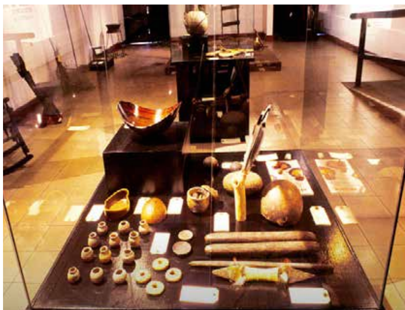
Objetos en madera, cerámica, tejidos y jícaros.