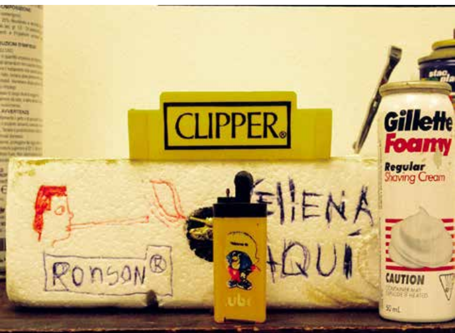
"Agua con Azúcar y muestra Provisional 1" del gabinete Ordo Amoris de Cuba.