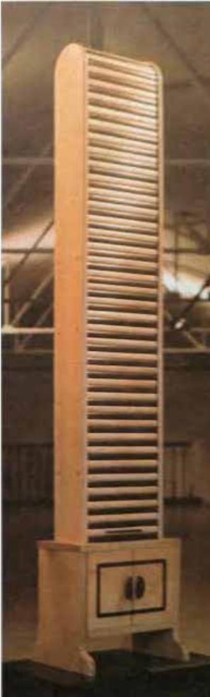
Rodolfo Morales. Intro-Retro, Muebles en madera de gravía y pejibaye. 1996.