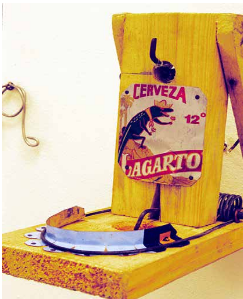
"Agua con Azúcar y muestra Provisional 1" del gabinete Ordo Amoris de Cuba.