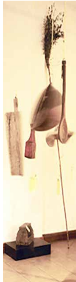
Objetos expuestos en Sala 2, detalle.

La calidad y creatividad fueron elevadas al podio que antes ocupara la escultura y la pintura, a partir de las grandes transformaciones tecnológicas que remozaron los procesos industriales.