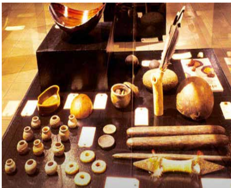
Objetos en madera, cerámica, tejidos y jícaros.