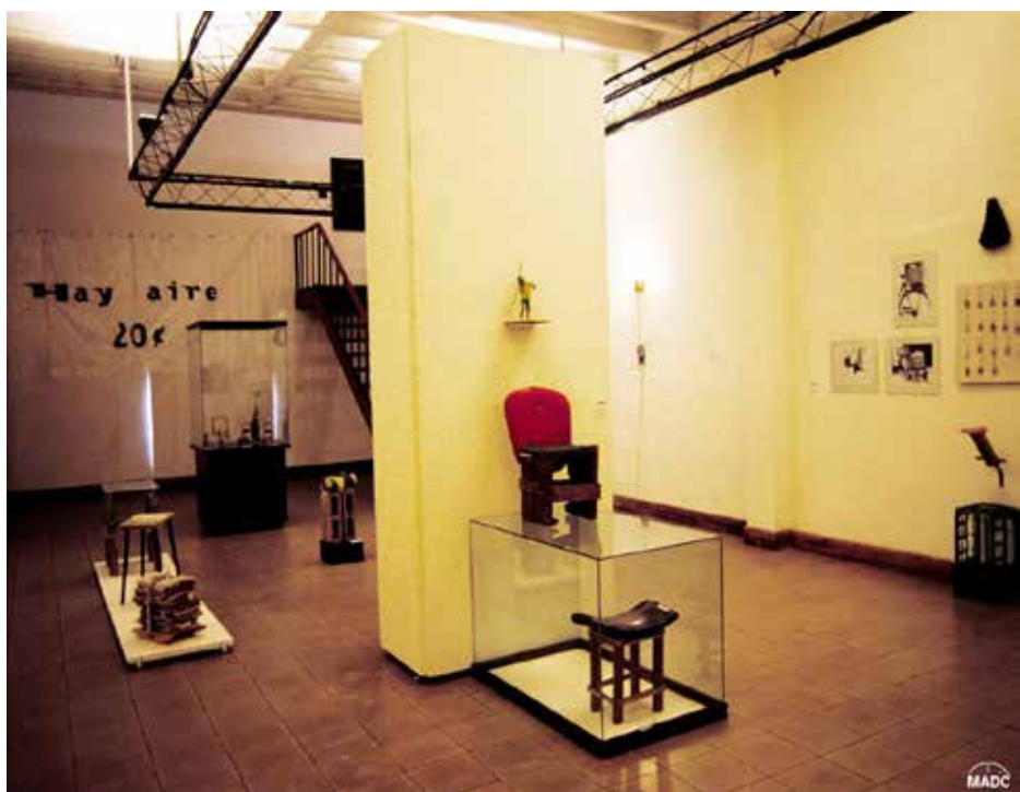
"Agua con Azúcar y muestra Provisional 1" del gabinete Ordo Amoris de Cuba.