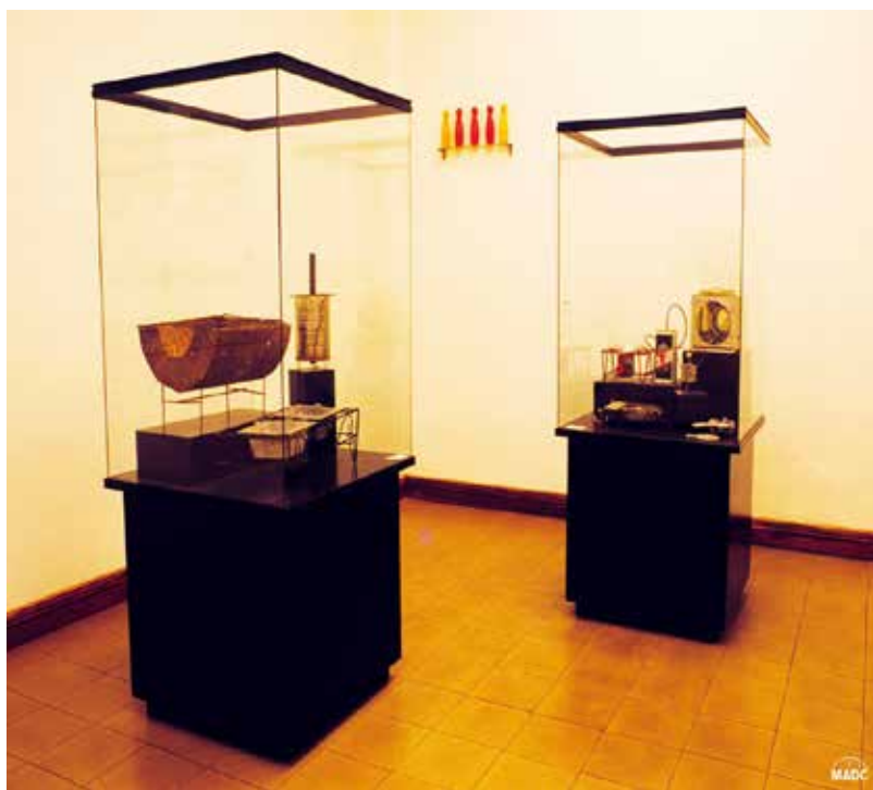
"Agua con Azúcar y muestra Provisional 1" del gabinete Ordo Amoris de Cuba.