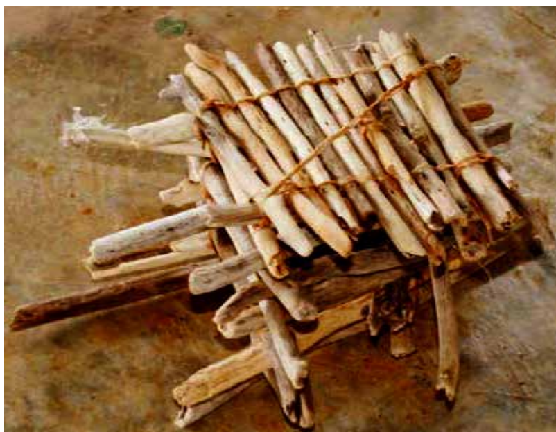
Nureca hecha por Odilí Vásquez de palos.