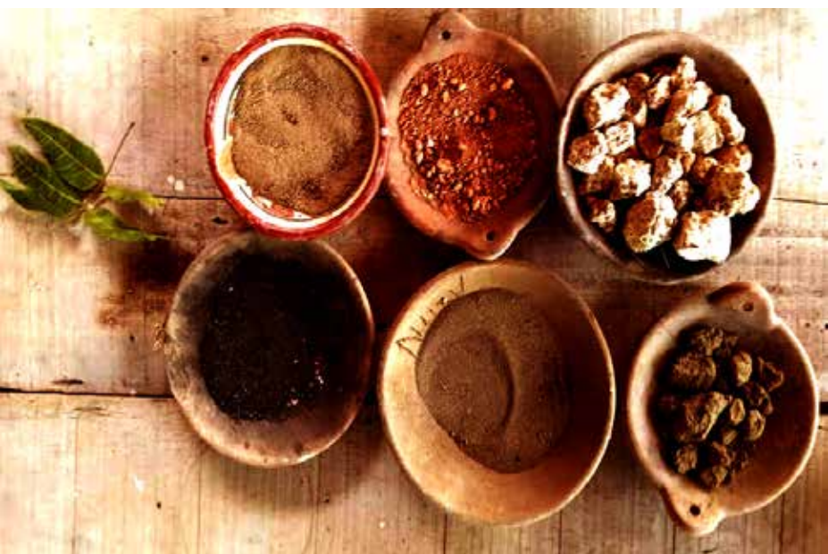
Preparación de los curioles para la cerámica.