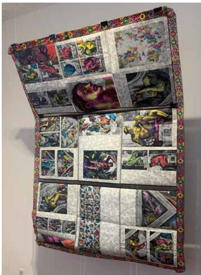
Yohanna M Roa, Mi Capilla Sixtina , 2021 Libro de historia del arte desmantelado, intervenido con acuarela, grabados en linóleo bordados y encajes.