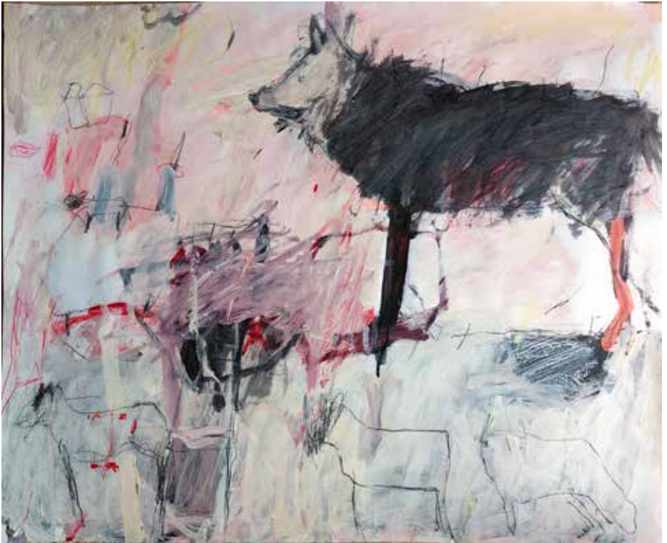
copyright_LianeMerz_from sheeps and humans_mixmedia on paper_83x59cm