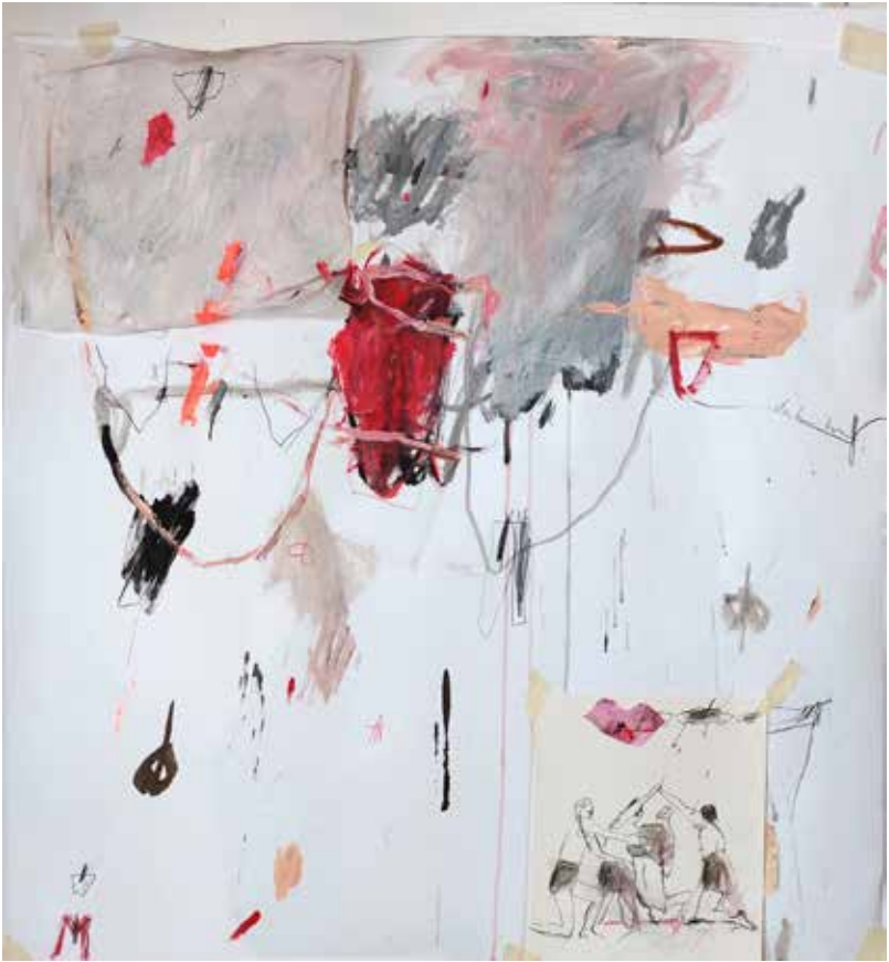
copyright_LianeMerz_work group fascism_doch turne_74x67cm_1