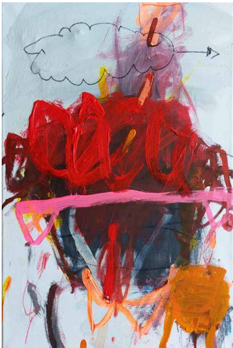
copyright_LianeMerz_No title_mixesmedia on canva_40x30cm