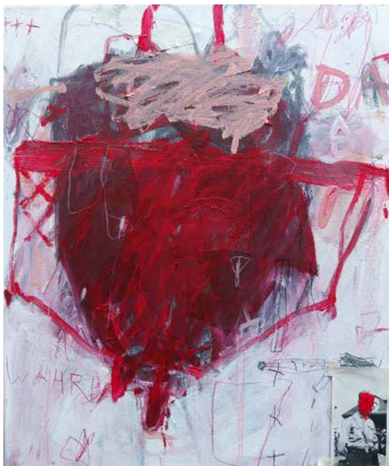
copyright_LianeMerz_work group fascism_40x40cm_painting_on_Canvas