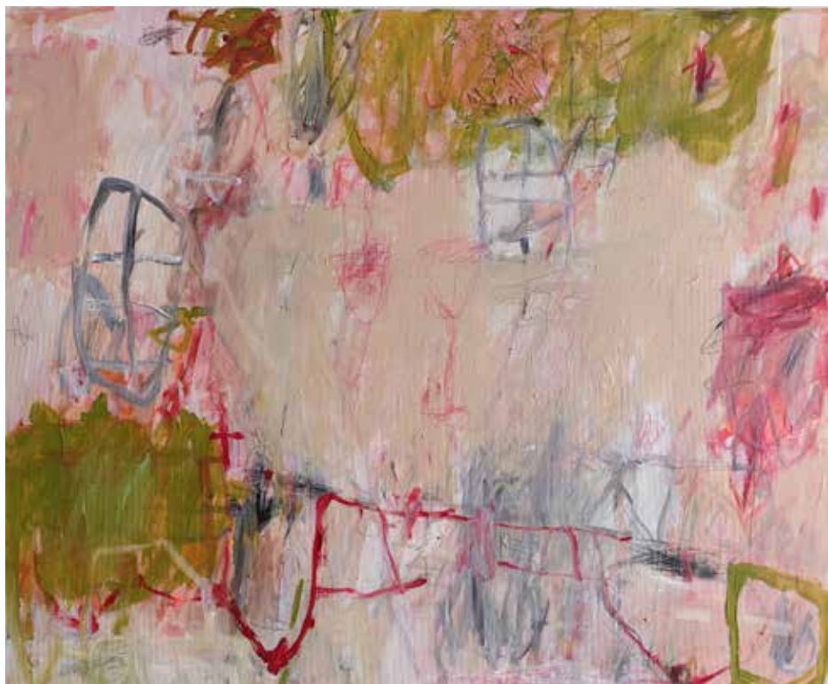
copyright_LianeMerz_No title_mixesmedia on canva_100x70cm_2