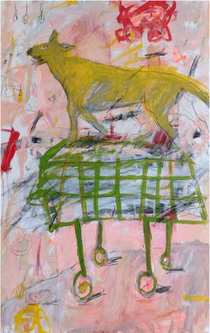
copyright_LianeMerz_tabledance_mixesmedia on canva_100x70cm