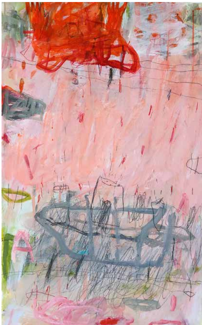
copyright_LianeMerz_No title_mixesmedia on canvas_50x70cm