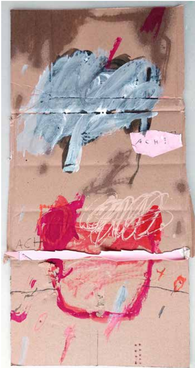
copyright_LianeMerz_from sheeps and humans_mixmedia on paper_39x59cm