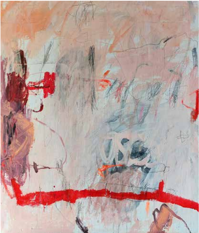
copyright_LianeMerz_No title_mixesmedia on canva_70x70cm