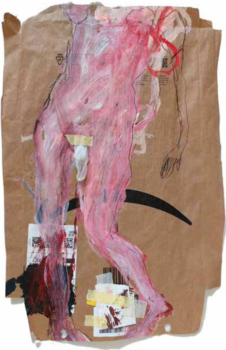
copyright_LianeMerz_from sheeps and humans_mixmedia on paper_39x59cm