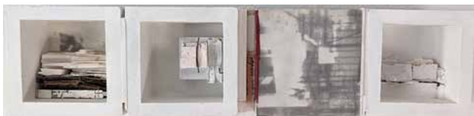
child's play, Jayne