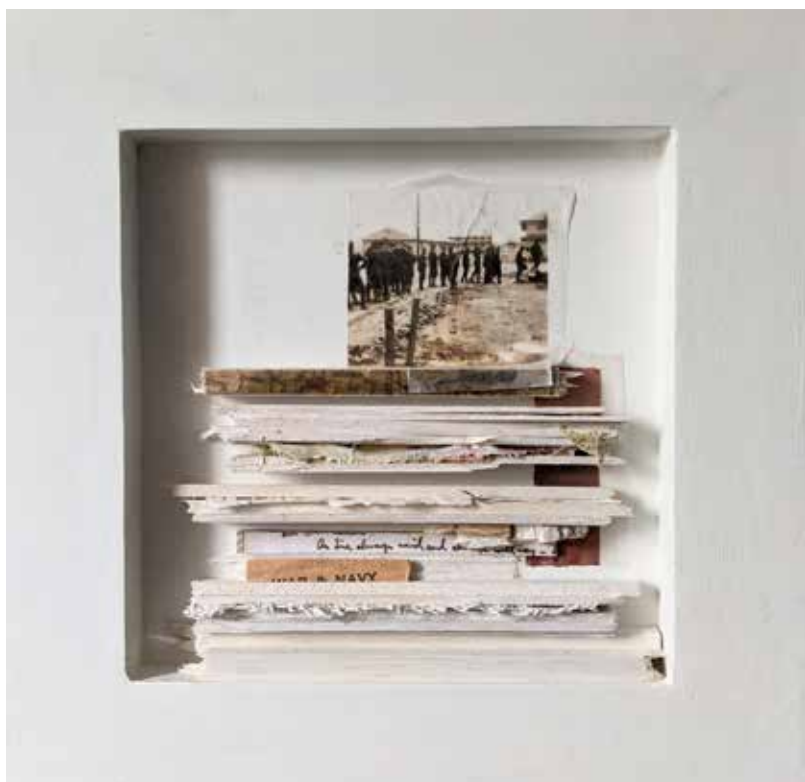
Beneath the floorboards3