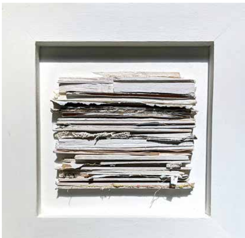
Beneath the floorboards4