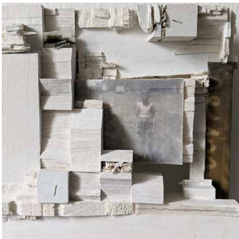
Child's Play 5