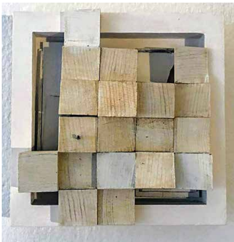
Beneath (some things will remain hidden)1