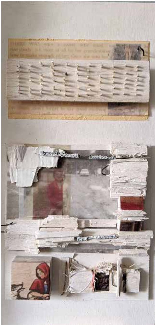
Child's Play, Little Red, Little Girl.jpg