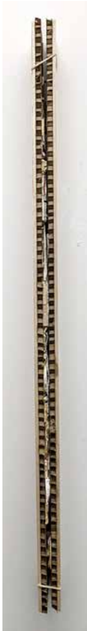
Between the Floor-boards, vertical.