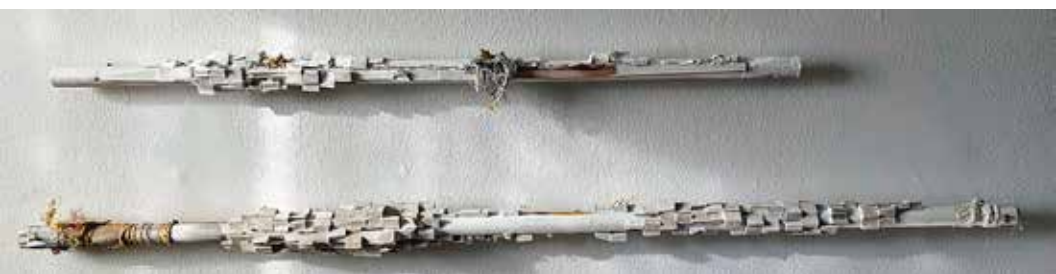
Broomsticks, vert. 2