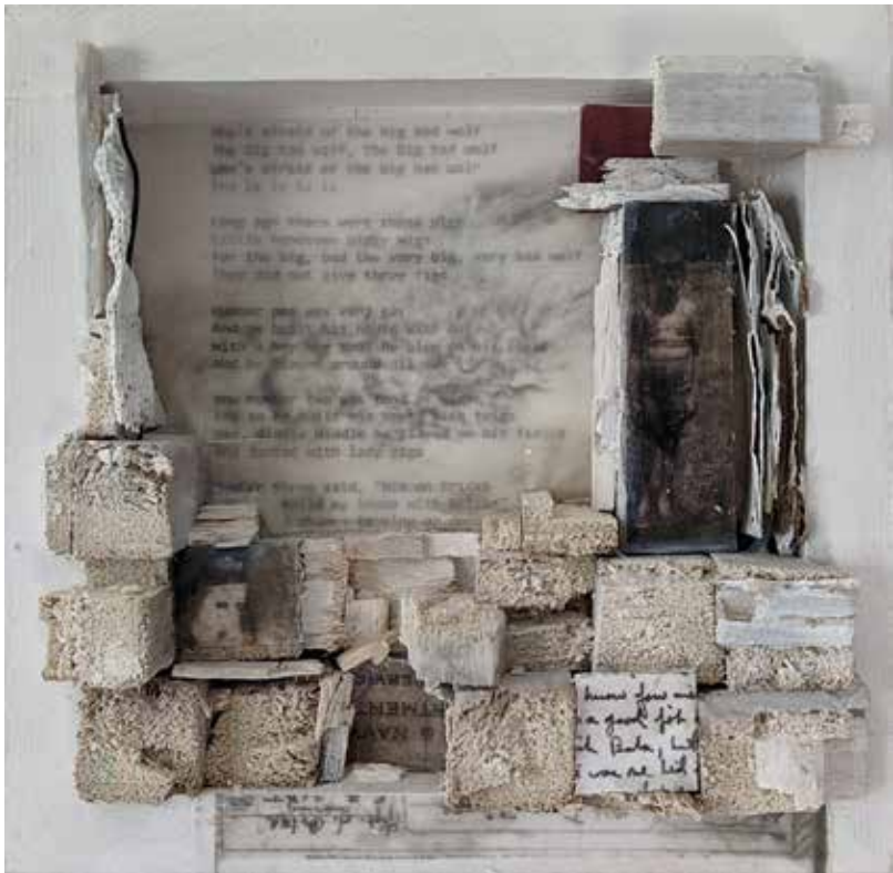
Child's Play 6