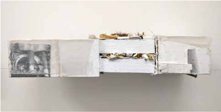
Child's Play P.O.W. 3