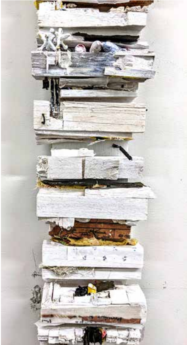
Beneath the Floorboards (vertical)(2)