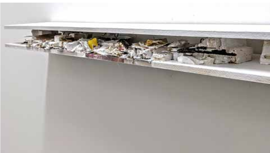
Beneath the Floorboards, interior view