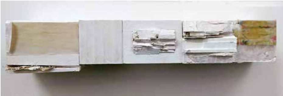
Child's Play P.O.W.