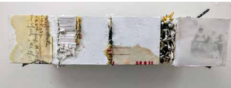
Child's Play P.O.W. 2