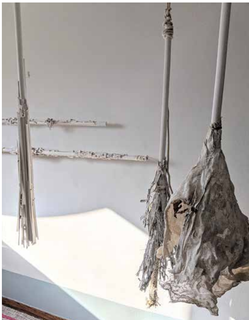
Hanging Broomsticks 4