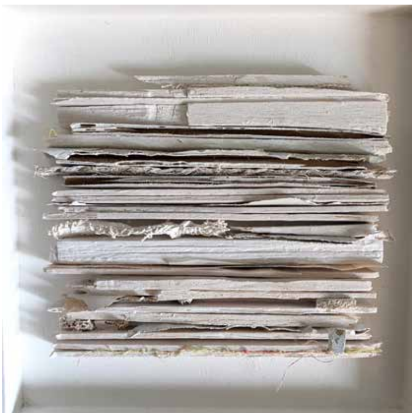
Beneath the floorboards4