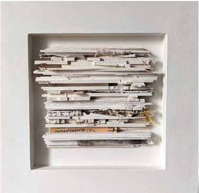
Beneath the floorboards2.