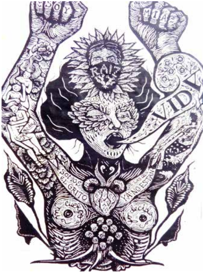
Anónimo, cartel en pared. Fotografía de Ricardo Ávila, 2023.