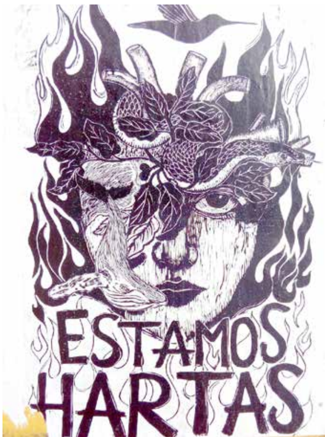
Anónimo, cartel en pared. Fotografía de Ricardo Ávila, 2023.