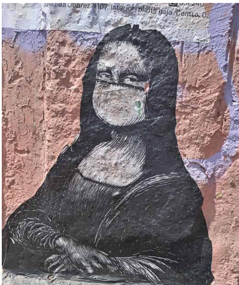
Anónimo, cartel en pared.