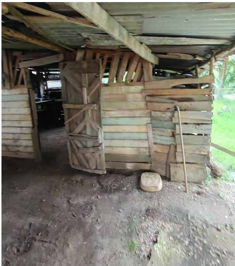
Una no casa localizada en Puerto San Pablo, Cantón de Nandayure, Guanacaste, hecha sin arquitecto ni diseñador, con maderas encontradas y reutilizadas. A non-house located in Puerto San Pablo, Canton of Nandayure, Guanacaste, made without architect or designer, with woods found and reused.