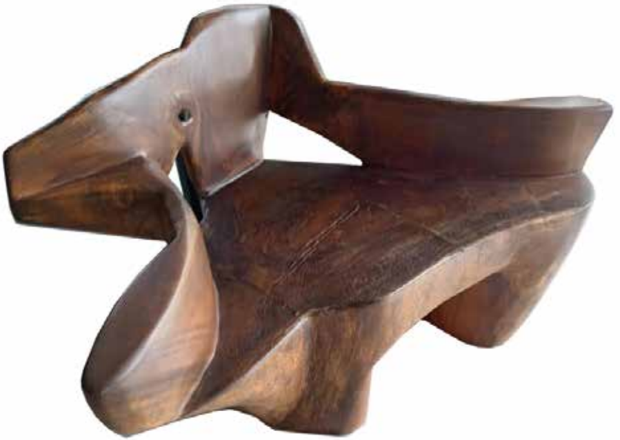
Un no asiento hecho del tronco de un árbol Enterolobium ciclocarpun , diseño vernáculo de la zona de Nicoya, provincia de Guanacaste. A non-seat made from the trunk of an Enterolobium ciclocarpun tree, vernacular design from the area of Nicoya, province of Guanacaste.